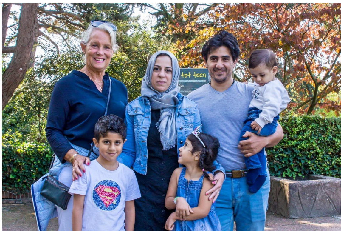
1 Groepsbezoek in Avifauna.

Het totaal aantal koppels sinds januari 2016 dat actief is, of is geweest, bedraagt 305. In het jaar 2018 zijn uiteindelijk tweehonderd koppels actief geweest!