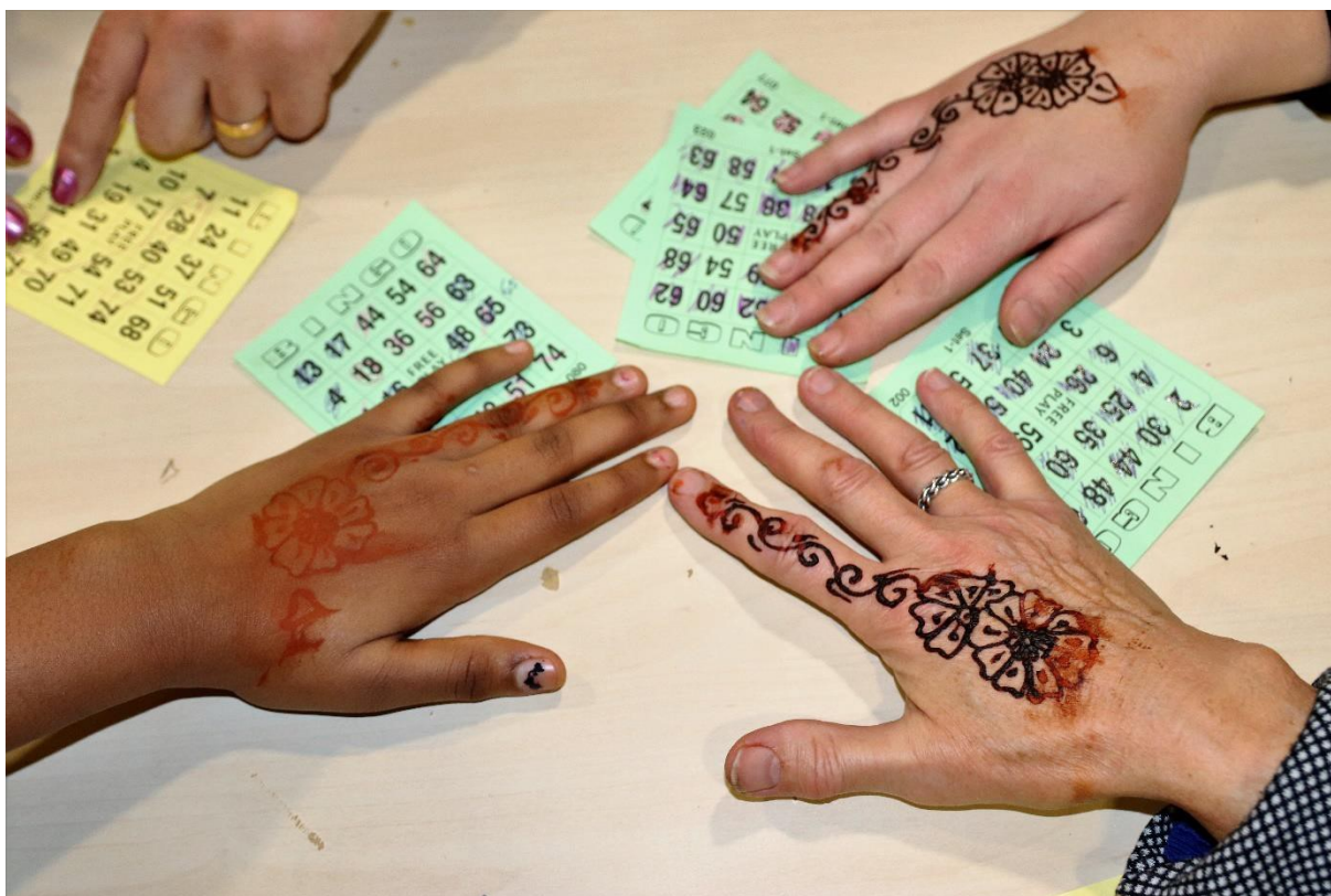
4 Ladies Night met bingo en henna-art.