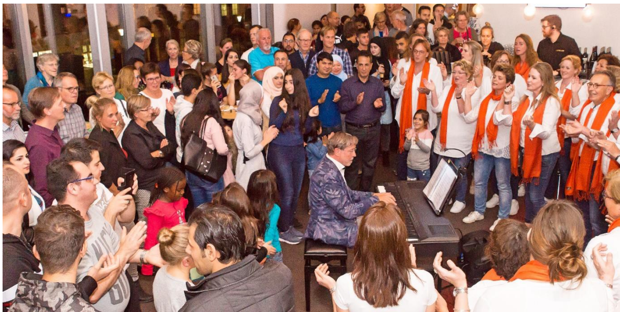
3 Inloopavond in Theater Castellum.